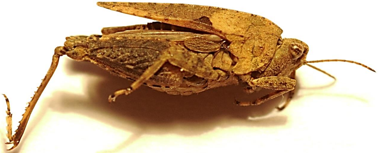
Vue de profil (droit).