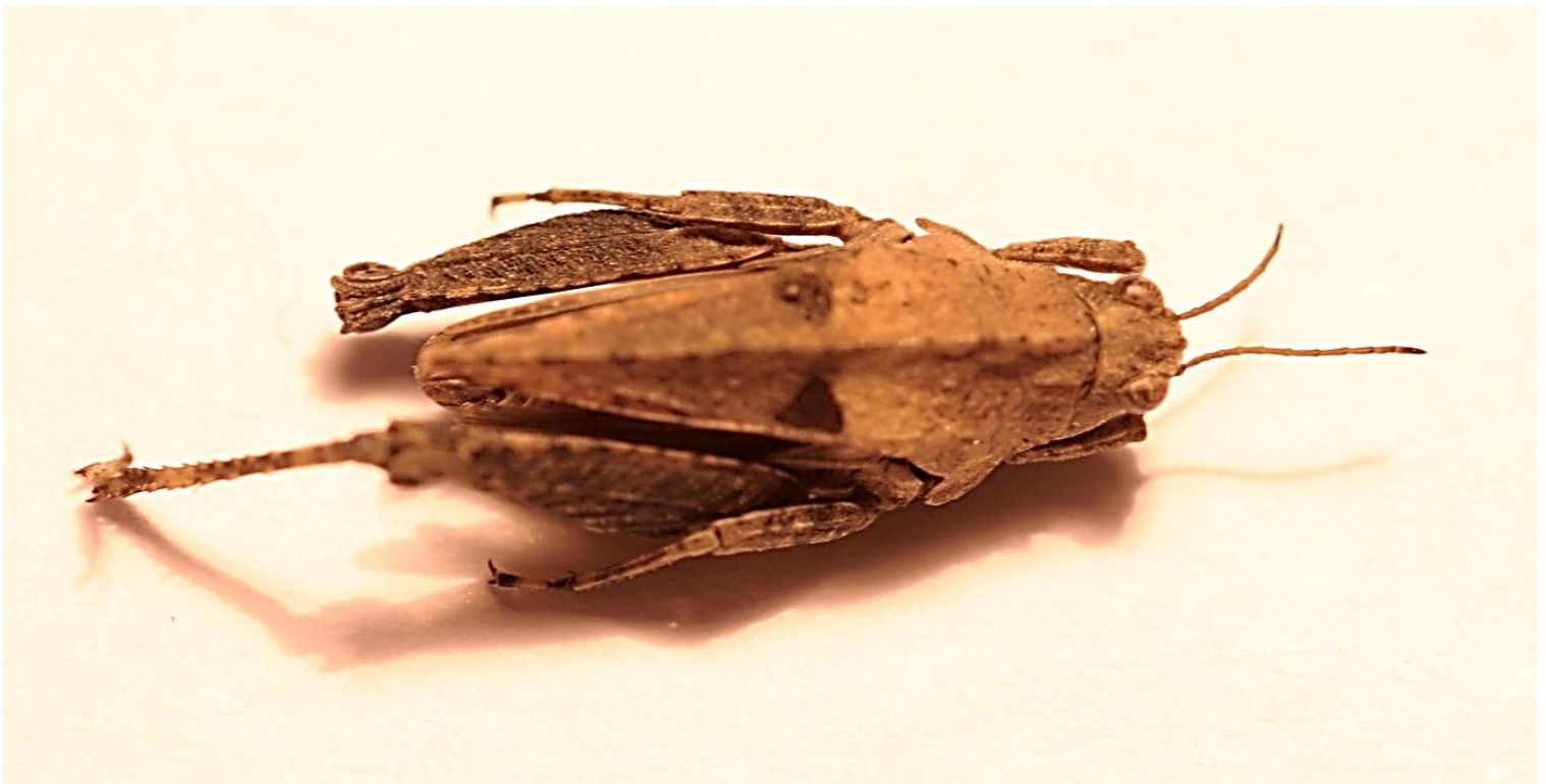
Vue de dessus, détails vertex.

Clichés de l'individu pris le 3 avril