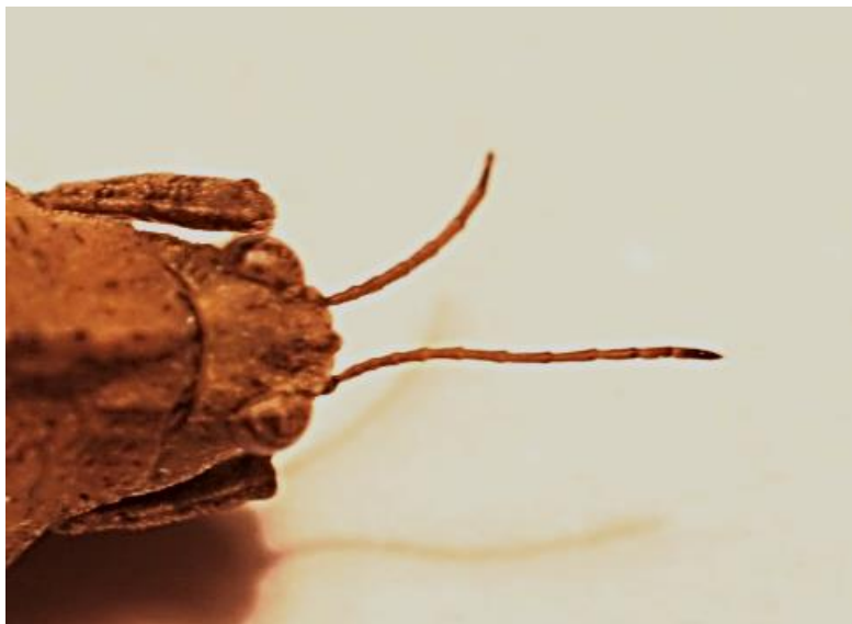
Vue de dessus, détails antennes.